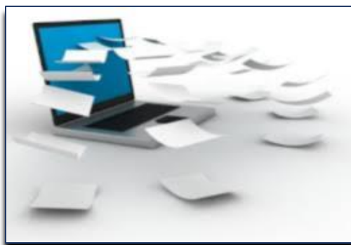
Imagen No .1

La política de Gestión Documental del ICETEX está conformada por el Programa de Gestión Documental PGD, los procedimientos de Gestión documental, las Tablas de Retención Documental y los demás lineamientos relacionados en circulares y guías establecidos por la entidad en torno a la Gestión Documental.