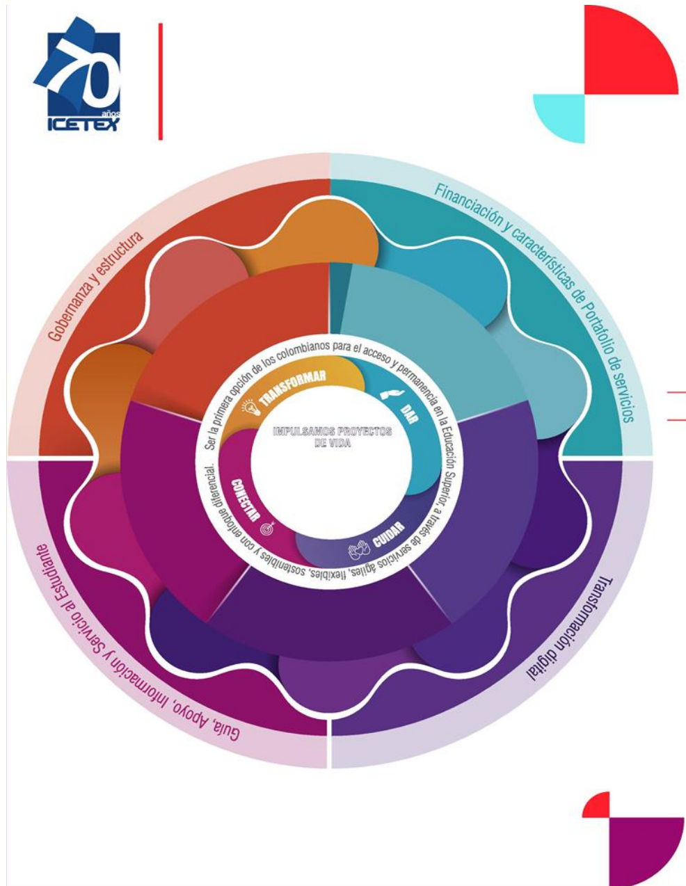
Figura No, 1 Mándala Estratégica

La mándala estratégica en ICETEX se establece como la representación gráfica de la estrategia institucional. Nace como respuesta a la necesidad de dar a conocer y promover, al interior de la entidad y a los grupos de valor, el plan estratégico; de manera sencilla, clara y en una sola imagen. La Mándala se encuentra desplegado en niveles, que a su vez se pueden clasificar en tres partes: