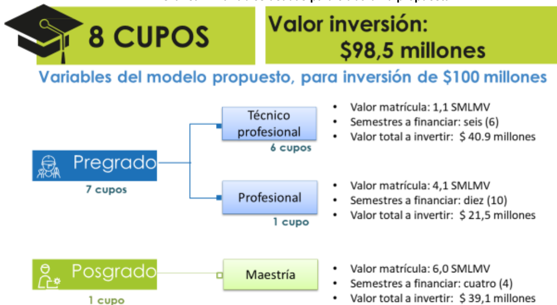
Gráfica 2. Variables usadas para elaborar la propuesta

SMLMV: Salario mínimo legal mensual vigente