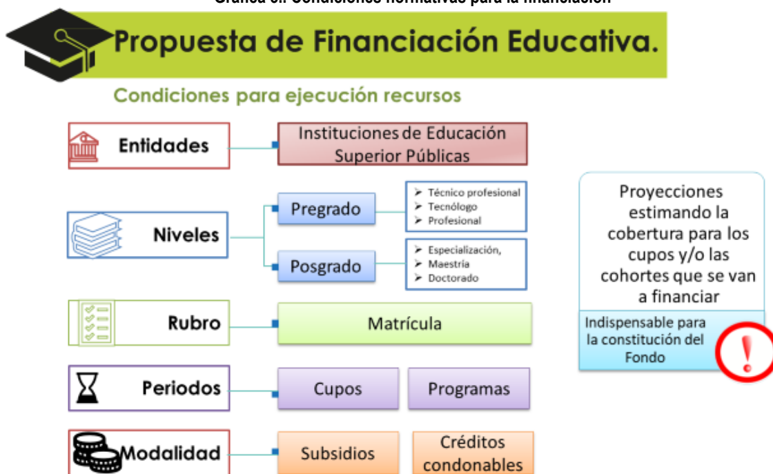
Grafica 3.. Condiciones normativas para la financiación

Nota: Los niveles de formación, periodos y la modalidad a financiar se definen con el Constituyente.